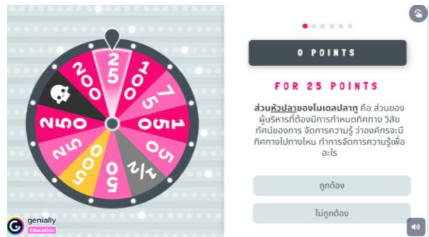
ภาพที่ 2 หน้าจอคำถาม