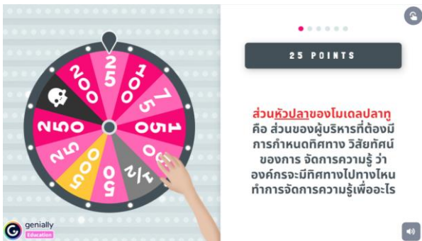
ภาพที่ 3 หน้าจอรายละเอียดคำตอบ