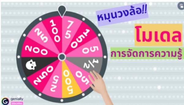
ภาพที่ 1 หน้าจอการเริ่มต้นเกม

การจัดวางออกแบบและพัฒนาในรูปแบบเนื้อหาด้วยเทคนิคของเกมมิฟิเคชันนี้ ผู้วิจัยสังเกตเห็นว่ามีผลต่อการเรียนรู้ของผู้เรียน เนื่องจากรูปแบบเกมมิฟิเคชัน เป็นเครื่องมือแบบที่ผู้เรียนสามารถโต้ตอบหรือปฏิสัมพันธ์ได้อย่างอิสระ ซึ่งเนื้อหาที่ออกแบบด้วยเกมมิฟิเคชันนี้มีความน่าสนใจ ประกอบด้วย ภาพ เสียงประกอบ และสีที่น่าสนใจดึงดูดเป็นอย่างมาก เมื่อผู้เรียนตอบคำถามจากการเล่นเกมได้ถูกต้อง จะได้คะแนนเพิ่มมากขึ้นจนถึงแต้มข้อคำถามสุดท้าย แต่เมื่อผู้เรียนตอบคำถามผิด จะย้อนกลับไปเริ่มต้นคำถามใหม่ ดังภาพที่ 1 ถึง ภาพที่ 6