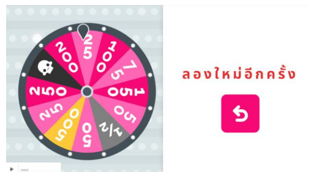
ภาพที่ 6 หน้าจอเมื่อตอบคำถามผิด

หลังจากที่ผู้เรียนได้เรียนด้วยเทคนิครูปแบบของเกมมิฟิเคชัน ในรายวิชาการจัดการองค์ความรู้ เรื่อง โมเดลการจัดการองค์ความรู้ เสร็จสิ้นแล้ว จากนั้นผู้วิจัยได้ดำเนินการเก็บรวบรวมข้อมูลจากกลุ่มเป้าหมาย จำนวน 13 คน โดยแบ่งการวิเคราะห์ผลออกเป็น 2 ตอน ได้แก่ ตอนที่ 1 เปรียบเทียบผลสัมฤทธิ์ทางการเรียนก่อนเรียนและหลังเรียนของผู้เรียนและค่าเฉลี่ยส่วนเบี่ยงเบน